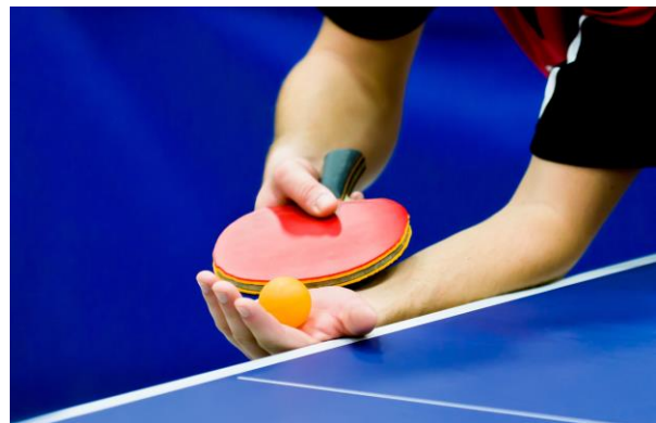
Schon beim Anschlag zeigt sich der wahre Meister.